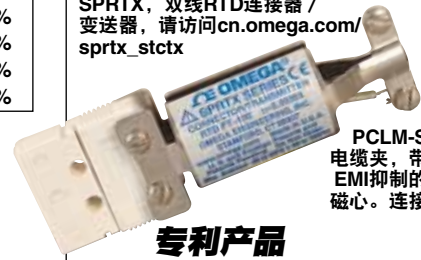
PCLM-SMP-FT 电缆夹，带有用于EMI抑制的铁氧体磁心。连接器单独销售。

SPRTX, 双线RTD连接器 / 变送器, 请访问 cn.omega.com/sprtx_stctx