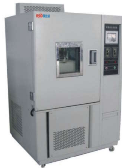
可程式恒温恒湿试验箱