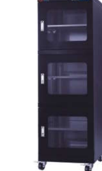
RSD-730F 防静电防潮箱 内尺寸: W596*D670*H1720mm