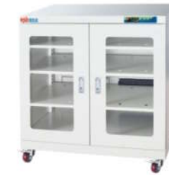
RSD-320 电子防潮箱 外尺寸: W900*D450*H1010mm

控湿存储标准符合J-STD-033B标准, 适用于各类精密零件、组装过程中的存放, 如: MSD湿敏元件, 集成电路, 电子, 光电, 新能源, 生化医药、金属物质、精密仪器等。