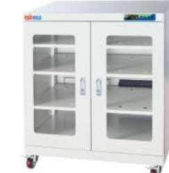
RSD-450 电子防潮箱 外尺寸: W900*D600*H1010mm