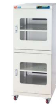
RSD-540 电子防潮箱 外尺寸: W600*D700*H1480mm