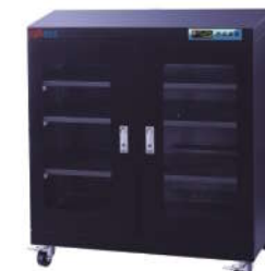
RSD-450F 防静电防潮箱 内尺寸: W896*D570*H850mm