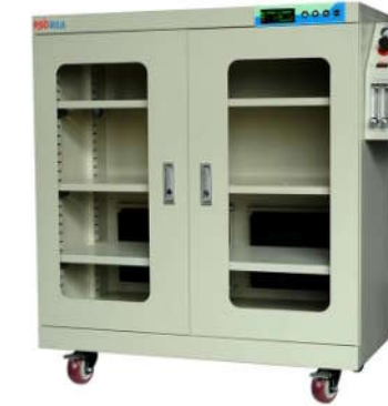
RSD-450SN 智能双流量氮气柜