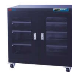
RSD-320F 防静电防潮箱 内尺寸: W896*D420*H850