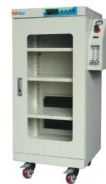
RSD-160SN 智能双流量氮气柜