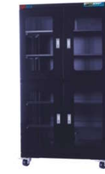
RSD-870F 防静电防潮箱 内尺寸: W896*D570*H1700