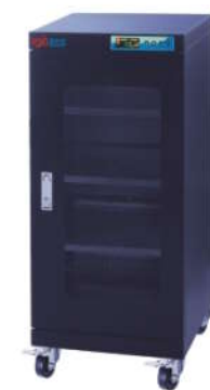
RSD-160F 防静电防潮箱 内尺寸: W446*D420*H850mm