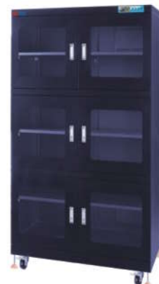
RSD-1400F-6防静电防潮箱 内尺寸: W1196*D670*H1720mm