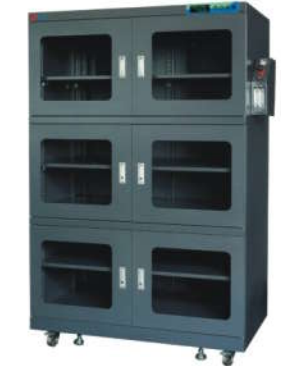
RSD-1400SN-6F 智能双流量氮气柜