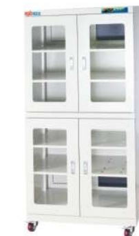
RSD-870 电子防潮箱 外尺寸: W900*D600*H1850mm