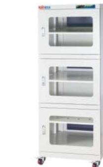
RSD-730 电子防潮箱 外尺寸: W600*D700*H1890mm