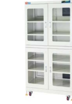
RSD-1400-4 电子防潮箱 外尺寸: W1200*D700*H1890mm