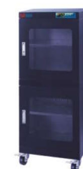
RSD-540F 防静电防潮箱 内尺寸: W596*D670*H1300