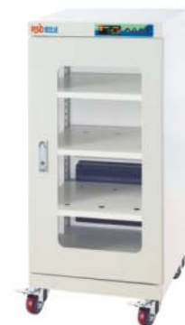
RSD-160 电子防潮箱 外尺寸: W450*D450*H1010mm