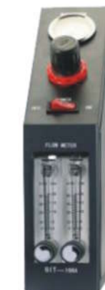
双流量节氮控制器