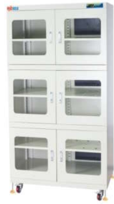
RSD-1400-6电子防潮箱 外尺寸: W1200*D700*H1890mm