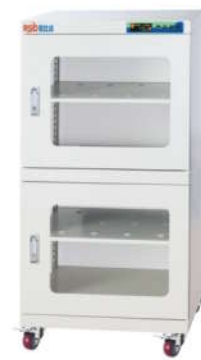
RSD-240 电子防潮箱 外尺寸: W600*D400*H1300mm