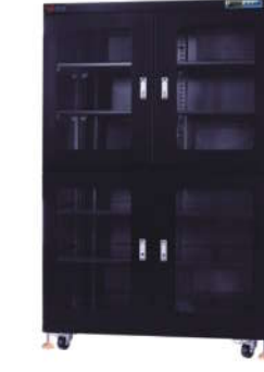
RSD-1400F-4 防静电防潮箱 内尺寸: W1196*D700*H1720mm