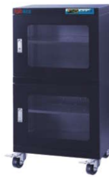
RSD-240F 防静电防潮箱 内尺寸: W596*D370*H1150mm