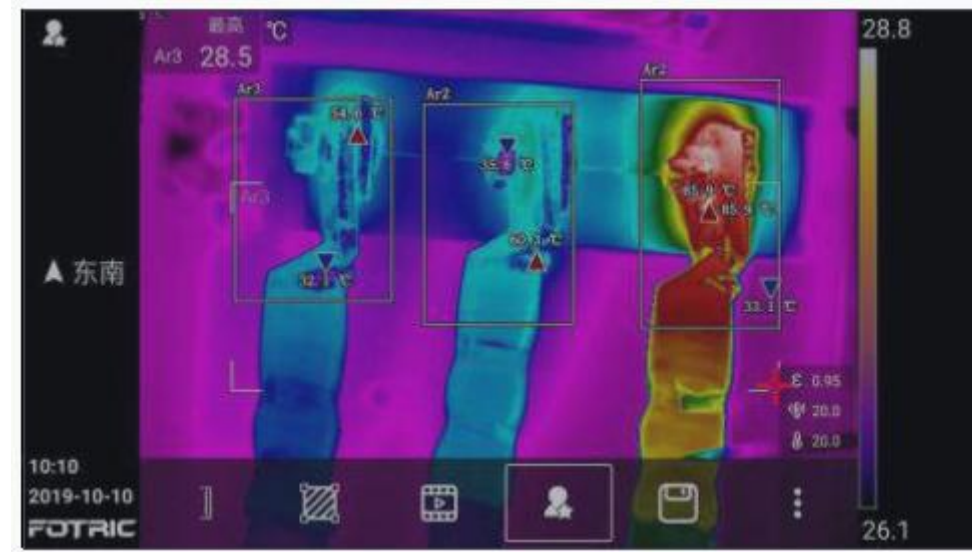
便于筛选的收藏标注

通过收藏标注功能，用户可以在热像仪上快速标记有异常的热像图片，并且可以在热像仪的图库内快速筛选和查找到标注过的热像图片。