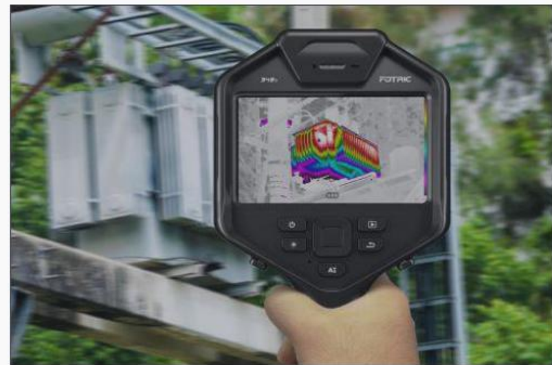
使用MagicThermal 多色动态成像功能后