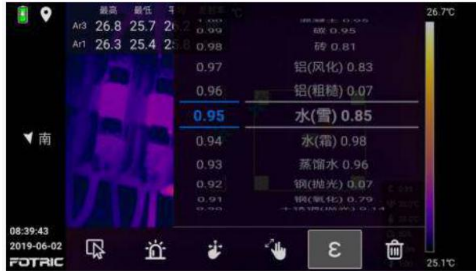
本机即时分析热像图和分区设置发射率

FOTRIC 323Pro 具备专业的本机分析功能，在检测现场即可对拍摄的热像图片进行专业分析，避免重复拍摄，大幅提高现场诊断效率。同时可以对不同目标区域单独设置发射率，实现不同材质的准确测温。