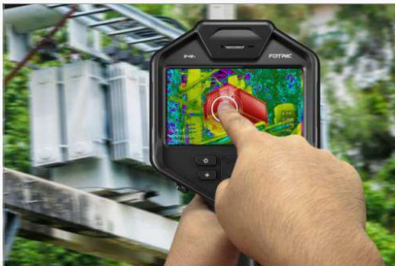
使用MagicThermal 多色动态成像功能前