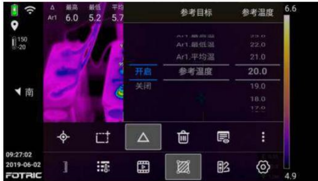
全屏温升显示和相间温差计算

本机可以设置环境温度为基准温度，屏蔽环境温度干扰，自动计算设备的温升，同时可以自动计算电气设备的相间温差，实现更科学的诊断分析。