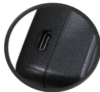
USB Type C 接口