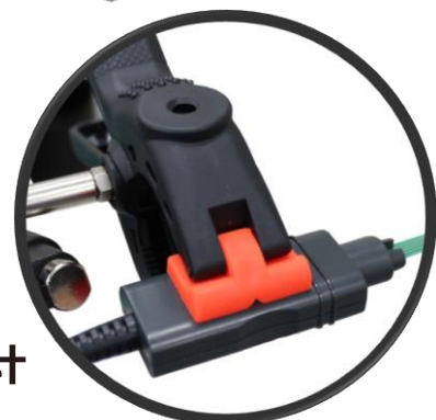
探头手持柄扁平设计