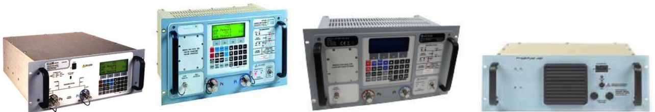
ADTS405 大气数据测试系统|ADTS403 大气数据测试系统|PV103