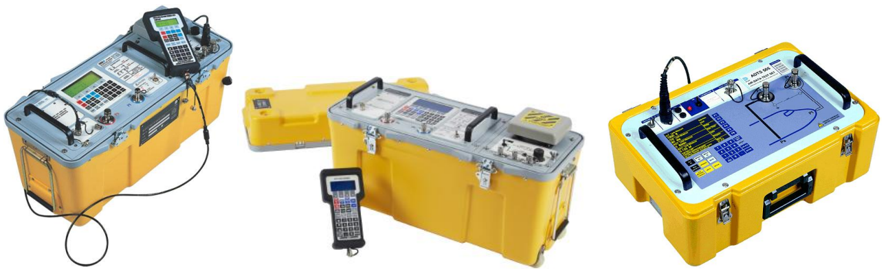
ADTS405F 大气数据测试系统|ADTS505 大气数据校验仪