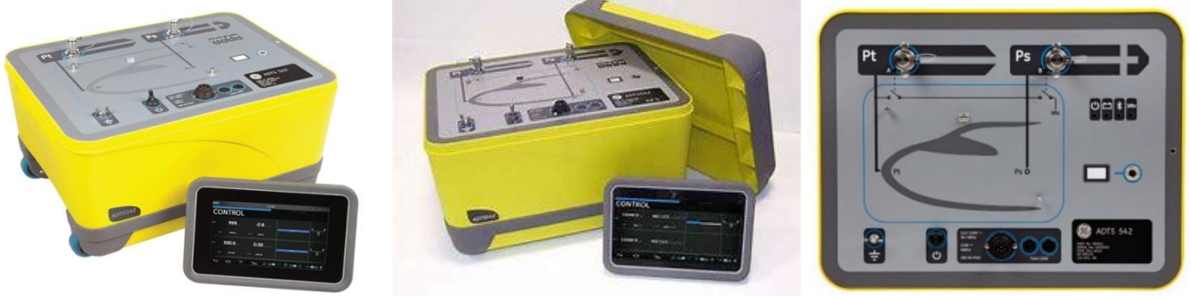
ADTS542F 动静压测试仪|ADTS552F 大气数据测试仪|ADTS553F