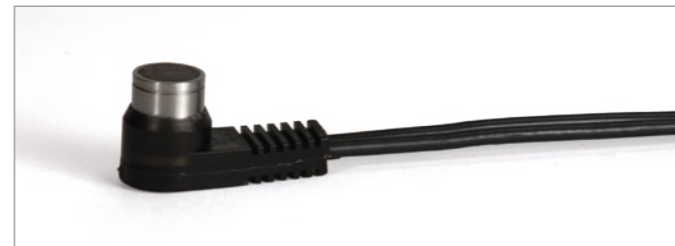
D7910探头性能强大, 价格便宜

27MG测厚仪的标准配置中包含经济实用的D7910双晶探头，用户使用这款探头可以完成很多基本腐蚀应用的测厚操作。奥林巴斯还备有种类齐全的双晶探头系列产品，可以对极薄、极厚的材料，或小直径管件进行测量。与27MG测厚仪兼容的奥林巴斯探头带有自动探头识别功能，可通过自动调用默认V声程校正的方式，优化探头的性能。