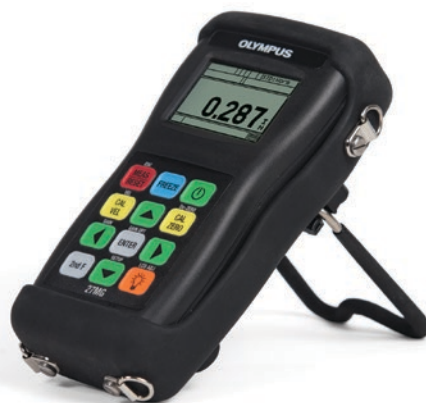
装有可选橡胶保护套的27MG测厚仪, 保护套上带有颈挂带和仪器支架

根据您所在地区的不同, 标准套件可能会有所不同。要了解详细情况, 请联系您所在地的经销商。