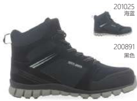
201025 海蓝 200891 黑色