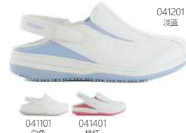
041101 白色 041401 桃红