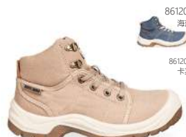
861201 海蓝 861200 卡其