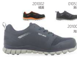
201002 橘黄 010531 黑色 201005 海蓝

大底 飞龙/橡胶 鞋头 超轻纳米碳 中底 超轻高强度芳纶军用防弹材料 内衬 透气网布 鞋垫 SJ Hybrid 抗菌减震超轻EVA 防护等级 SIP / SRC ESD 码段 欧 35-47 · 英 4-12 · 美 4.5-13 · 厘米 23-31