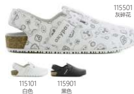
115101 白色 115901 黑色