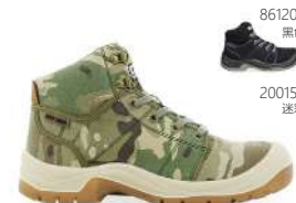
861202 黑色 200159 迷彩