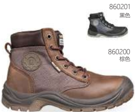
860201 黑色 860200 棕色