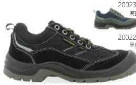
200230 海蓝 200229 黑色