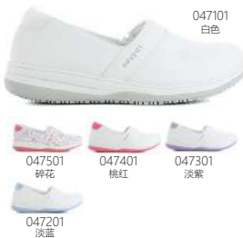
047501 碎花 047401 桃红 047301 淡紫 047201 淡蓝