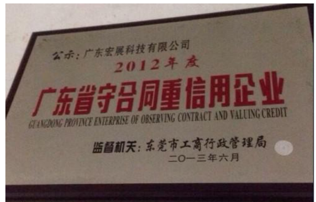
守合同重信用企业