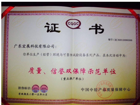
质量、信誉双保障单位