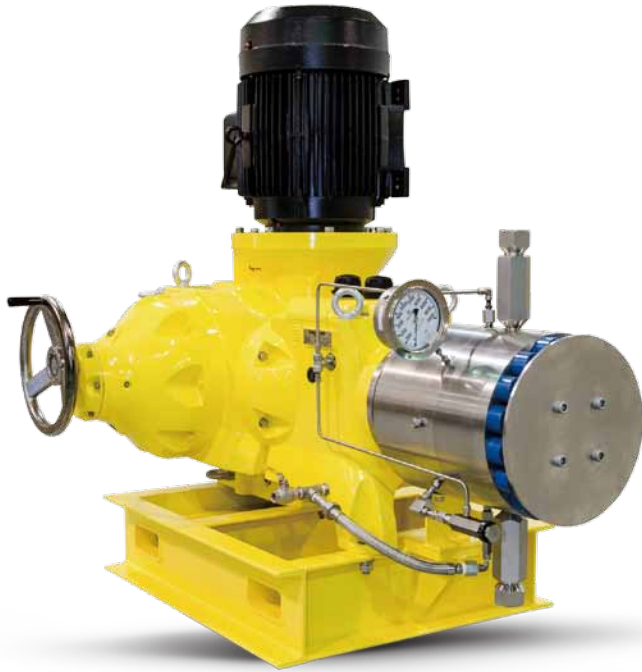
金属双隔膜液力端，立式电机，手动冲程调节PX泵

米顿罗新型 Primeroyal X 系列计量泵适用于 1,380BAR (20K PSIG) 的高压力应用环境，满足高压力大流量输送的需求。