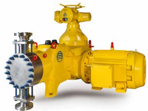
PTFE(Teflon®)双隔膜金属液力端，卧式电机，电动冲程调节PX泵

蓝色虚点代表 Primeroyal 系列原有的能力范围，PX 的推出提高了 Primeroyal 系列的整体能力。