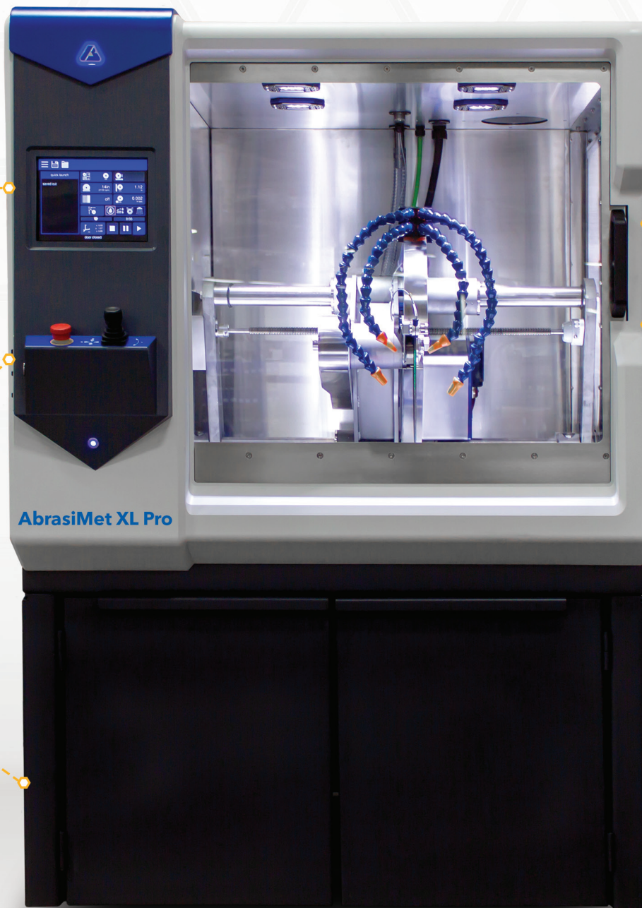
AbrasiMet XL Pro