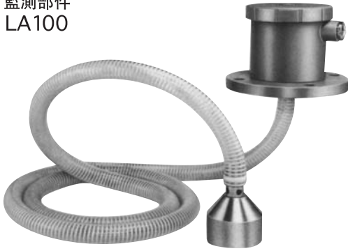
LA100型: L尺寸 (Max.) = 10m LA110型: L尺寸 (Max.) = 4m