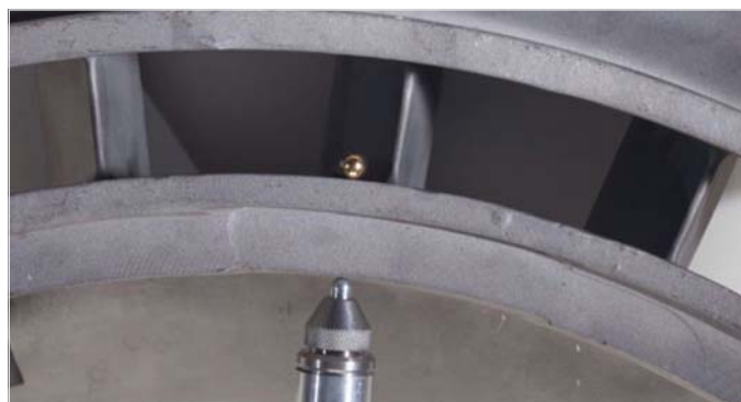
对24.1毫米的航天器铸件进行测量

Magna-Mike已被成功地应用于航空航天领域的质量控制程序中，对由复合材料及非铁性材料制成的航空航天器的各个部件进行测量。