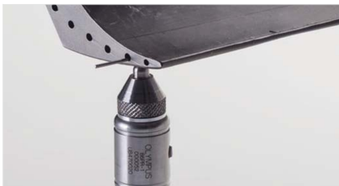
使用目标钢线对涡轮叶片进行测量

目标钢线可被插入到涡轮叶片的冷却孔中，而较大的磁性目标钢珠可用于测量最厚达25.4毫米的喷气式引擎部件。