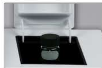
采用直径 \Phi 25mm管比色