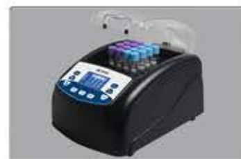
配套5B-1 (V8) 消解仪