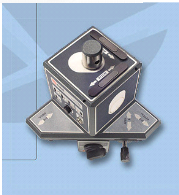
L-730 单激光平面发射器