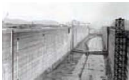
在建造巴拿马运河期间，美国工人的死亡人数约为5,600人。

1912年，根据国家安全委员会的统计，美国有18,000至21,000名工人死于工伤。1913年，美国劳工部公布的死亡人数为23,000人。除揭发黑幕的记者外，依然没有抗议和调查行动。成千上万入境移民对工作的需求使得安全问题成为虚设。1900年至1910年之间，有九百万移民来到美国。第二次世界大战之后，许多工人基层的人过上了中产阶级的市郊舒适生活。