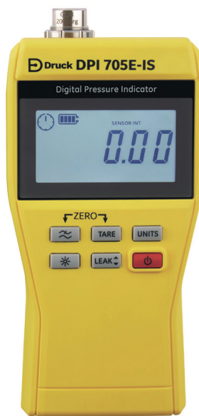
危险区压力指示仪