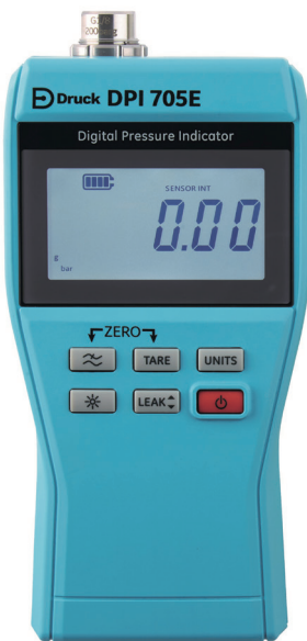
安全区压力指示仪