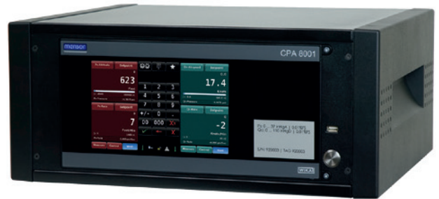
CPA8001型飞行数据控制器