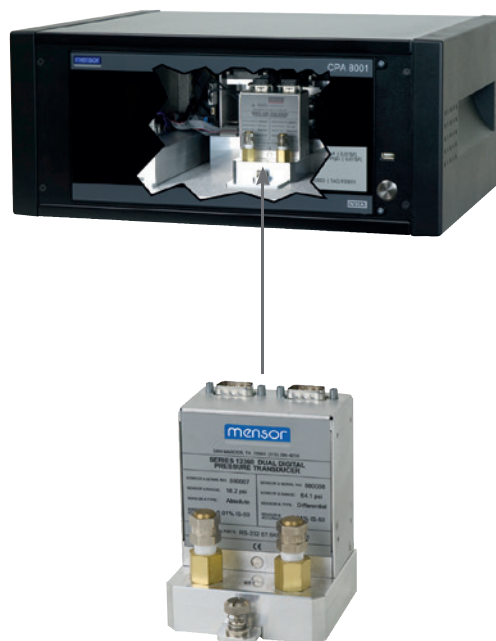
硬件的模块化零件 (CPR8001传感器)

模块化设计可简化维护。其中电子模块和控制器是独立组件, 无需维护。若必须维护, 所有部件都能拆除并使用新组件轻松更换。