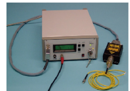
皮秒半导体激光器