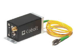
尾纤半导体激光器