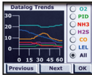
能够以图形的方式查看动态数据日志及直接读数