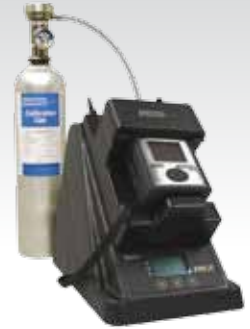
DS2 自动标定管理平台