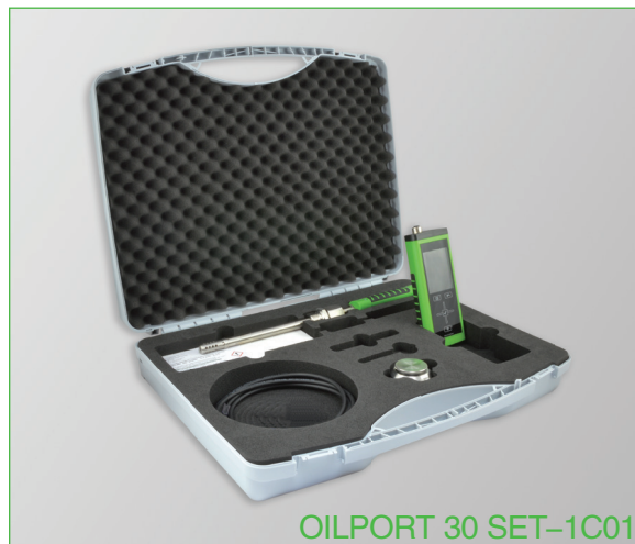
OILPORT 30 SET-1C01