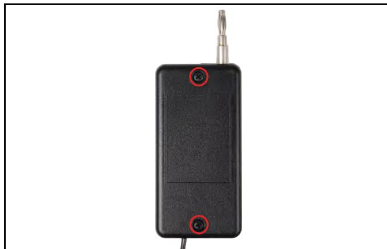
取下仪器背面 2 颗螺丝