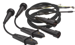
+ DH4-C 探针 1.5 m 导线