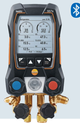
专业级四通数显冷媒表 testo 557s