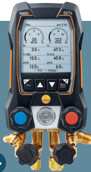
testo 557s 带蓝牙和四通阀组的 数显冷媒表