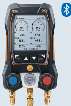
专业级数显冷媒表 testo 550s