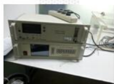
红外线气体分析仪