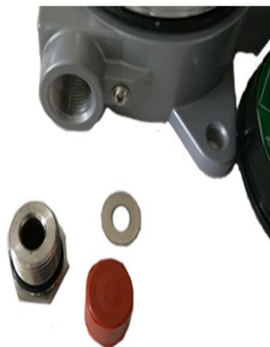
穿线孔的配件螺帽、胶塞、铁圈