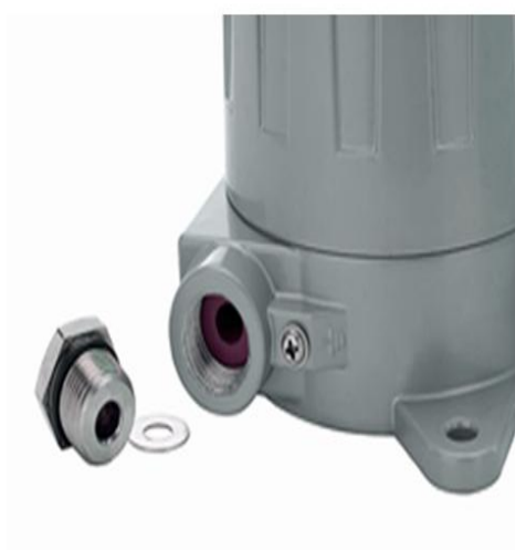
拧开检测仪穿线孔