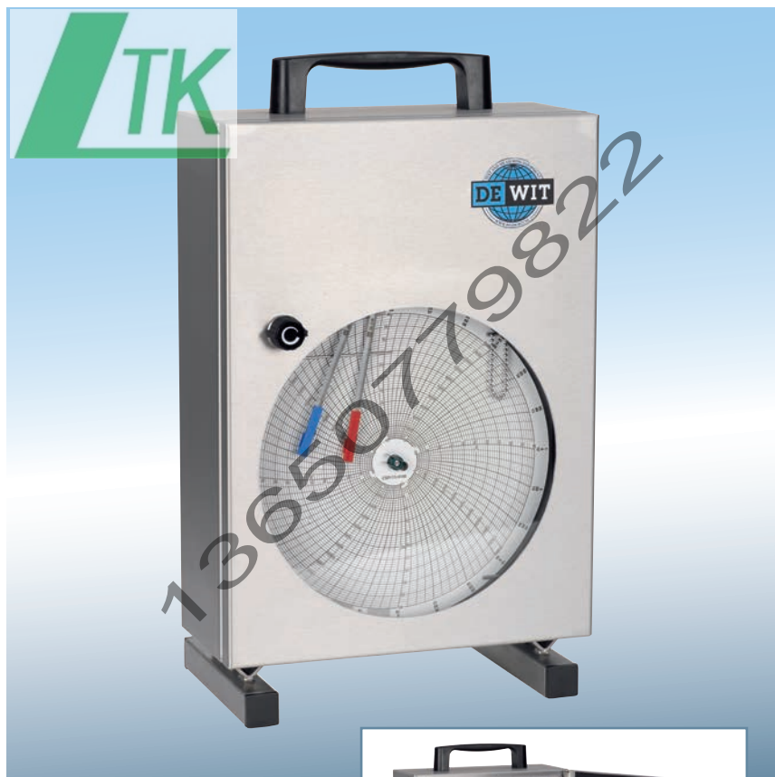
Rectangular 12" Chart Recorder De Wit model PP-12-T