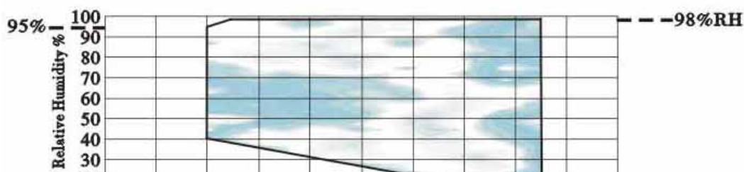
温湿度控制能力範圍 Humidity Control Range At+20℃ Ambient temperature or+25℃ water temperatured and non-loaded