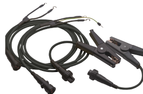
+ KC1 开尔文夹 3 m 导线