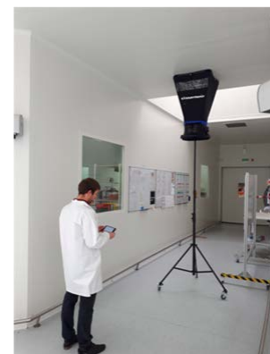
搭配可伸缩三脚架使用