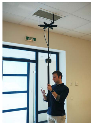
操作使用测量矩阵