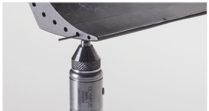
使用目标钢线对涡轮叶片进行测量