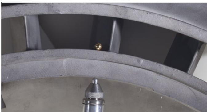
对24.1毫米的航天器铸件进行测量

Magna-Mike已被成功地应用于航空航天领域的质量控制程序中，对由复合材料及非铁性材料制成的航空航天器的各个部件进行测量。