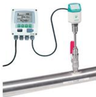
固定式流量装置 深圳时代之峰 www.zf116.com