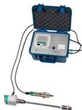
便携式流量装置 深圳时代之峰 www.zf116.com