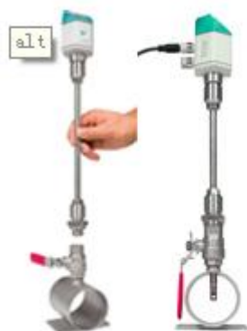
利用 1/2" 球阀带传感器的 深圳时代之峰 www.zf116.com